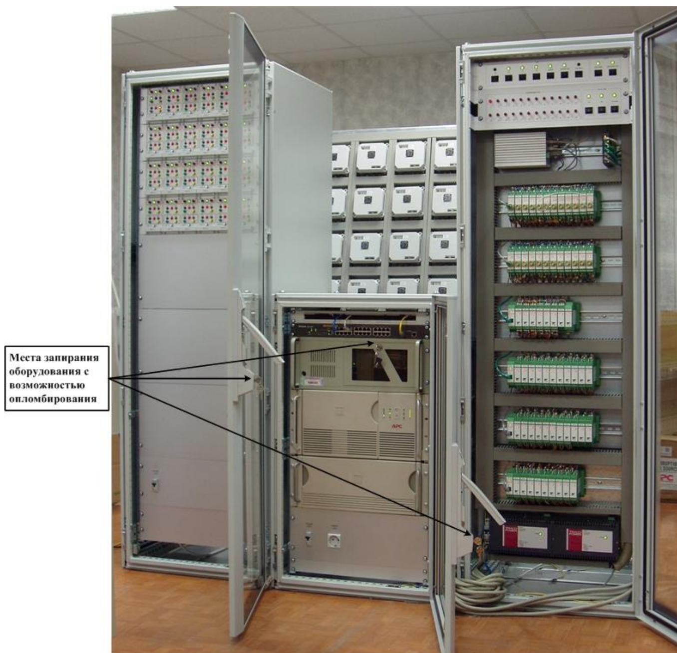
Рисунок 2 – Вариант исполнения системы измерительно-управляющей на основе программно-технического комплекса «Каскад-САУ»